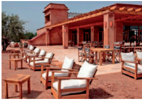
Kasbah du Toubkhal - Imilil (Maroc)

BioLodging est un réseau d'hôtels verts de charme, respectueux de l'environnement naturel et social, qui s'inscrivent comme de véritables acteurs du bien-être de leurs hôtes.